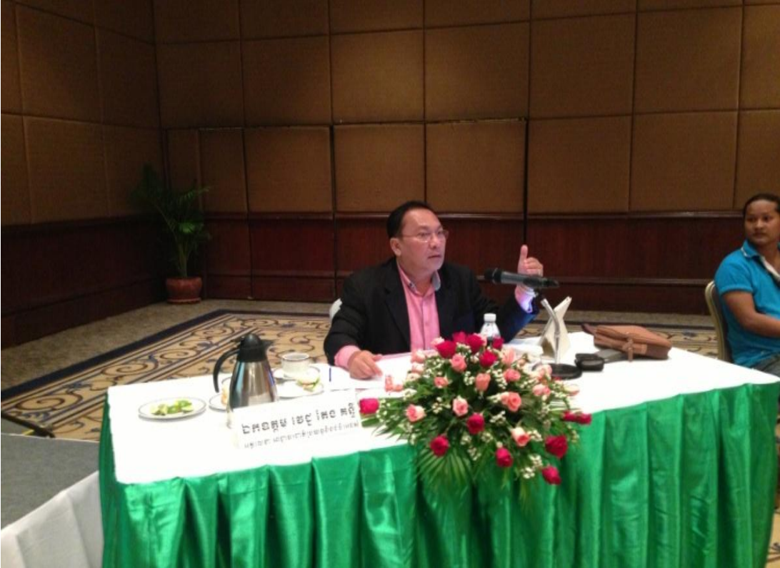
ប្រធាននៃកិច្ចប្រជុំ

កាលពីថ្ងៃសុក្រ ទី២៧ ខែមិថុនា ឆ្នាំ២០១៤ វេលាម៉ោង៨:០០នាទីព្រឹក នៅសណ្ឋាគារអាំងទែកុងទីណង់គាល់ក្រុមការងារលេខាធិការបុរសស្រឡាញ់បុរស និងស្រីស្រស់ សហការគ្នាជាមួយអង្គការគ្រួសារសុខភាពអន្តរជាតិ(FHI360) បានរៀបចំនូវកិច្ចប្រជុំប្រចាំត្រីមាសរបស់ខ្លួនក្រោមកិច្ចដឹកនាំប្រជុំដោយ ឯកឧត្តម តែង គន្ធី អគ្គលេខាធិការអាជ្ញាធរជាតិប្រយុទ្ធនឹងជំងឺអេដស៍ និងប្រធានក្រុមការងារបច្ចេកទេសថ្នាក់ជាតិបុរសស្រឡាញ់បុរស និងស្រីស្រស់ ក្រោមការឧបត្ថម្ភថវិកាពីគំរោង Flagship តាមរយៈអង្គការគ្រួសារសុខភាពអន្តរជាតិ(FHI360) ដោយសំរេចលទ្ធផលដូចខាងក្រោម៖