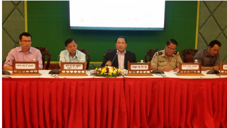
គណៈអធិបតីនៃកិច្ចប្រជុំ