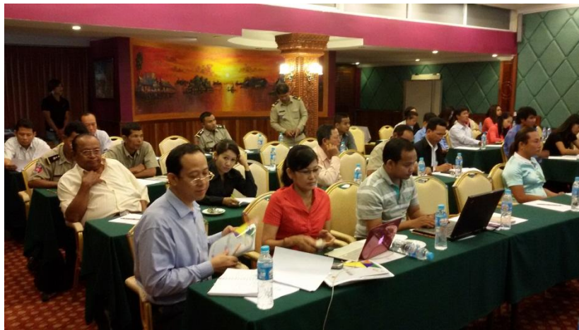
អ្នកចូលរួមមកពីស្ថាប័នរដ្ឋាភិបាល

ស្រស់ត្រូវមានភស្តុតាងឱ្យបានច្បាស់លាស់កុំចេះតែ ដើរចាប់ខ្លួនមិនរើសមុខឱ្យតែស្រីស្រស់ នោះ។