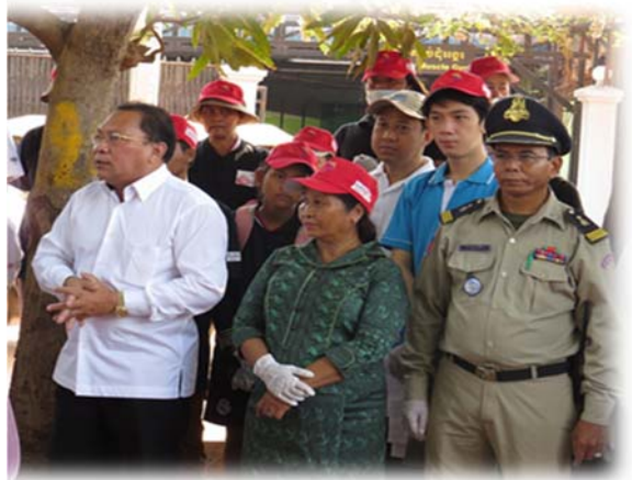
រូបភាព៖ យុទ្ធនាការបញ្ឈប់ការរើសអើង និងការមាក់ងាយលើក្រុមបុរសស្រលាញ់បុរស និងស្ត្រីបំឡែងភេទ