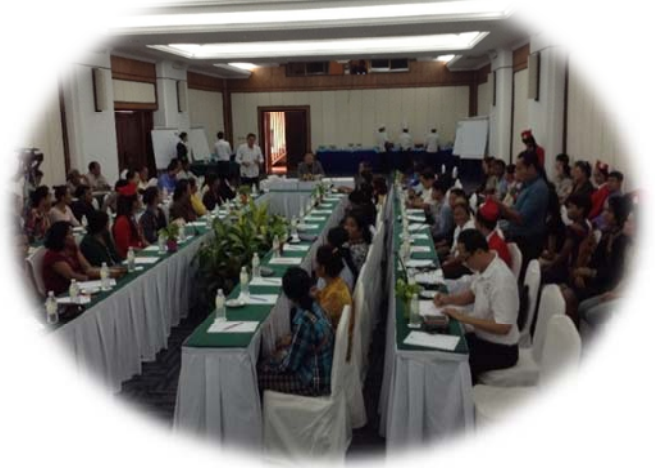
រូបភាពសកម្មភាពកិច្ចប្រជុំប្រចាំត្រីមាសក្រុមការងារថ្នាក់ក្រោមជាតិនៅខេត្តសៀមរាប