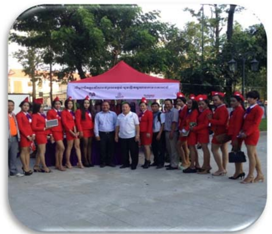
ពិពណ៌ស្រោមអនាម័យនៅសហគមន៍

អគ្គលេខាធិការនៃអាជ្ញាធរជាតិប្រយុទ្ធនឹងជំងឺអេដស៍ និងក្រុមលេខាធិការដ្ឋានបានចូលរួមយុទ្ធនាការទិវានៃក្តីស្រឡាញ់នៅរាជធានីភ្នំពេញ ដើម្បីលើកទឹកចិត្តក្រុមប្រឈមមុខខ្ពស់ក្នុងការប្រើប្រាស់ស្រោមអនាម័យ ការពារការឆ្លងមេរោគអេដស៍ និងចូលរួមផ្សព្វផ្សាយទៅដល់សហគមន៍ និងលើកទឹកចិត្តអោយពួកគាត់ប្រើប្រាស់ស្រោមអនាម័យ១០០%រាល់ការរួមភេទ។ ក្នុងនោះដែរអគ្គលេខាធិការនៃអាជ្ញាធរជាតិប្រយុទ្ធនឹងជំងឺអេដស៍ និងក្រុមលេខាធិការដ្ឋានបានចុះអភិបាលកិច្ចប្រចាំត្រីមាសជាមួយអង្គការដៃគូនៅក្នុងសហគមន៍ និងកន្លែងផ្តល់សេវាកំសាន្ត ដើម្បីពិនិត្យមើលការអនុវត្តន៍ប្រកាស០៦៦នៅកន្លែងធ្វើការ។