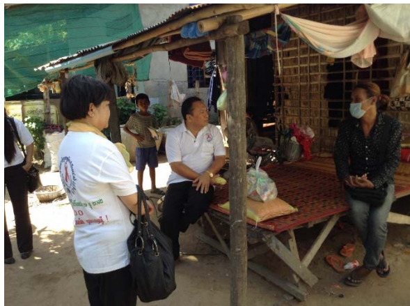
សកម្មភាពក្រុមការងារថ្នាក់ជាតិចុះសួរសុខទុក្ខអ្នកជំងឺអេដស៍នៅខេត្តសៀមរាប

ក្រុមការងារបច្ចេកទេសថ្នាក់ជាតិជាមួយអាជ្ញាធរជាតិប្រយុទ្ធនឹងជំងឺអេដស៍មជ្ឈមណ្ឌល ជាតិប្រយុទ្ធនឹងជំងឺអេដស៍ សើស្បែក និងកាមរោគ និងអង្គការដៃគូបានចុះអភិបាលកិច្ច ដើម្បីពិនិត្យមើលលើការអនុវត្តន៍កម្មវិធីបទអន្តរាគមន៍បង្ការទប់ស្កាត់ការរីករាលដាលមេរោគអេដស៍ និងជំងឺអេដស៍ ក្នុង