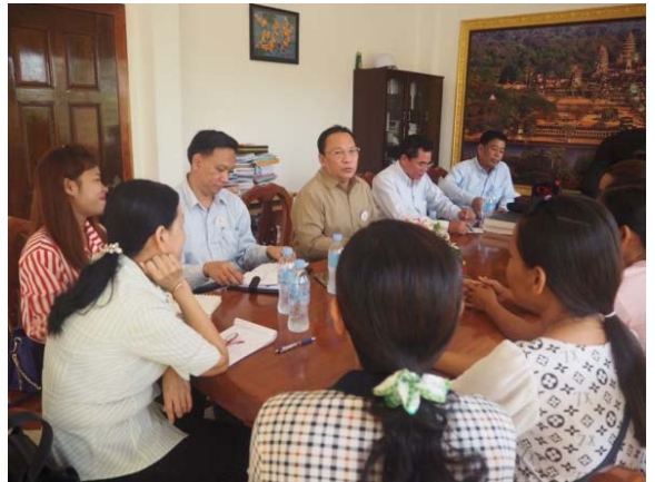
សកម្មភាពប្រជុំឯកឧត្តមអគ្គលេខាធិការជាមួយអ្នកផ្តល់សេវានិងក្រុមប្រឈមមុខខ្ពស់

កិច្ចប្រជុំប្រចាំត្រីមាសត្រូវបានរៀបចំឡើងជាមួយអ្នកផ្តល់សេវាសុខភាព ដូចជាមណ្ឌលសុខភាព គ្លីនិកសុខភាពគ្រួសារ គ្លីនិកអង្គការរ៉ាក់ គ្លីនិកសមាគមឈូកស គ្លីនិកអង្គការMEC និងអង្គការមិត្តសំឡាញ់ ដើម្បីធានាថា អ្នកផ្តល់សេវាមិនមានការរើសអើង និងមាក់ងាយទៅលើបុរសស្រលាញ់បុរស និងស្ត្រីបំប្លែងភេទ។ កិច្ចប្រជុំនេះដឹកនាំដោយឯកឧត្តមប្រធានក្រុមការងារ